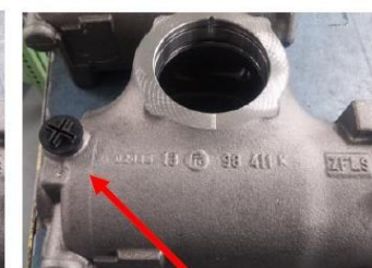
Mocno dokręć zaślepkę