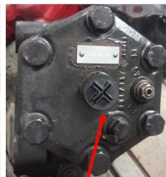
Mocno dokręć zaślepkę